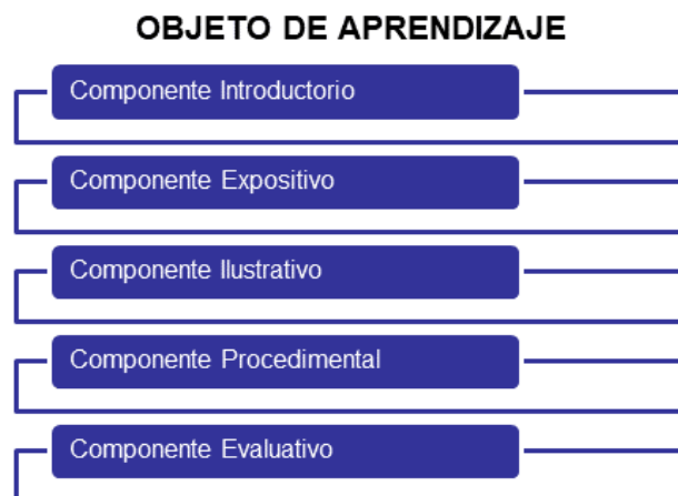
Gráfico Nro. 1: Estructura de un Objeto de Aprendizaje.

granularidad, reutilización e interoperabilidad. Los objetos son etiquetados con metadatos , esto es, cuentan con información que los describe, la cual permite su fácil localización a través de una búsqueda, una vez disponibles en repositorios de recursos educativos. El mismo autor define un objeto de aprendizaje como "documento digital, que nace con una clara vocación didáctica manifestada a través de una estructura multinivel que responde a los principios del diseño instructivo de una pedagogía activa orientada al desarrollo de competencias y cuyos componentes pueden ser recuperados y reutilizados gracias a estar dotados de descripciones precisas de sus características y contenidos y estar incorporados a repositorios o bibliotecas digitales, principalmente educativas". Respondiendo a este marco conceptual se concibe un modelo de objeto de aprendizaje basado en una estructura que responde a la función didáctica de sus componentes. La estructura prototípica resultante reúne los componentes que figuran en el esquema que sigue: